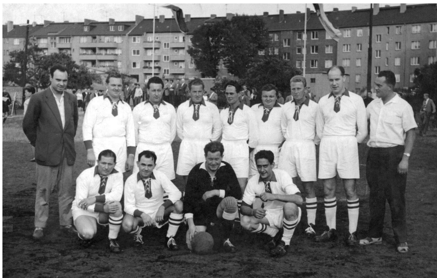
Der SV Duissern 1956