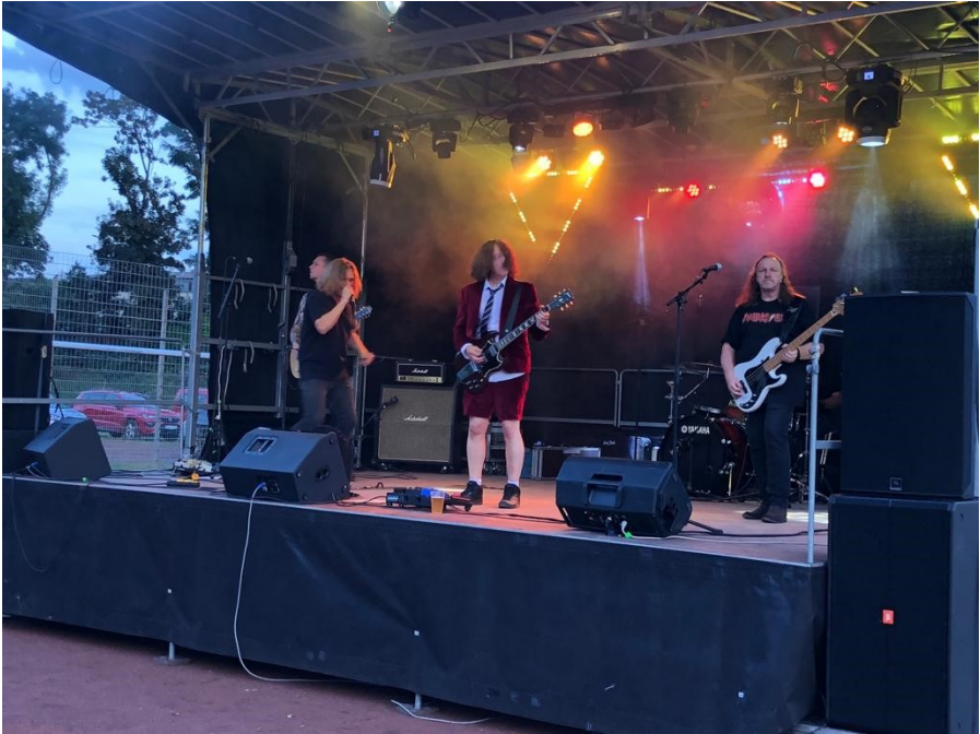
Die Cover-Band „Power up“ heizte uns allen richtig ein