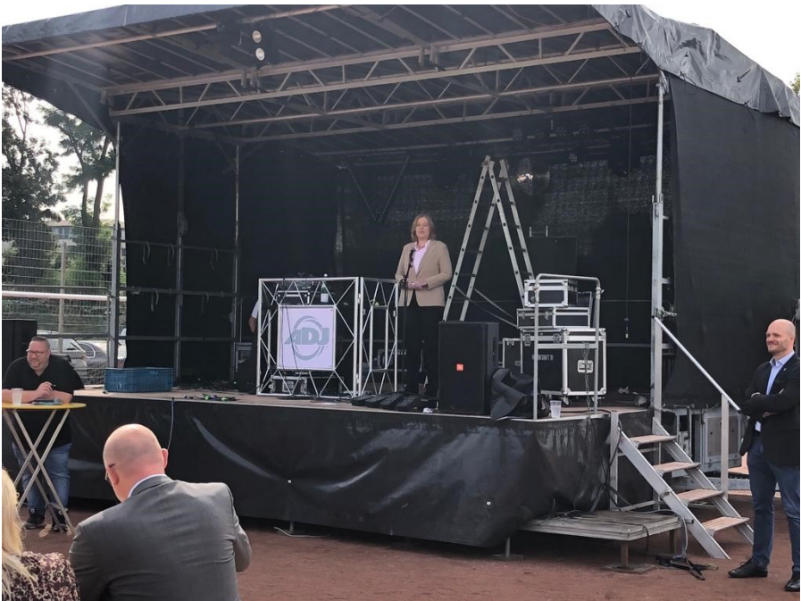
Bundestagspräsidentin Bärbel Bas bei ihrer Rede zum Jubiläum