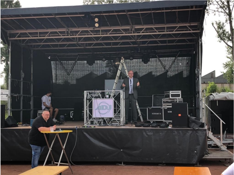
Unser Oberbürgermeister, Sören Link, vertrat die Stadt Duisburg