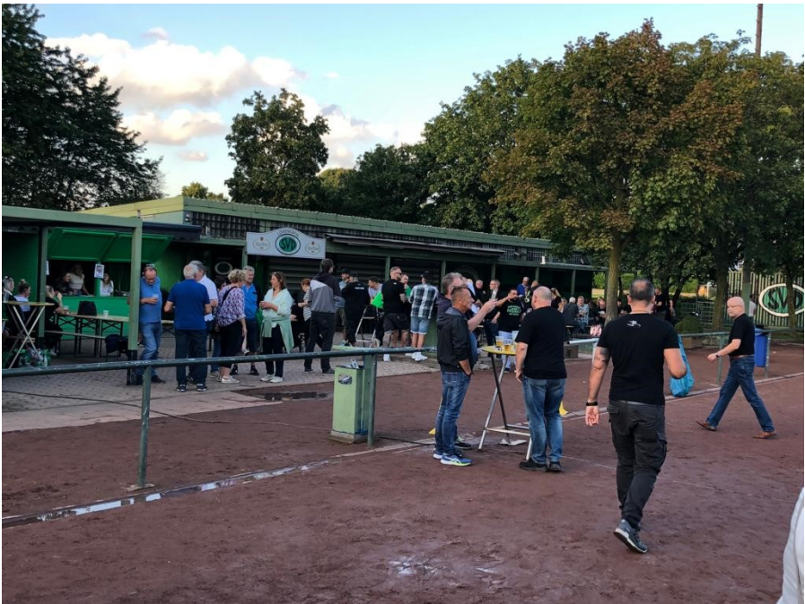
Eintreffen der vielen Gäste