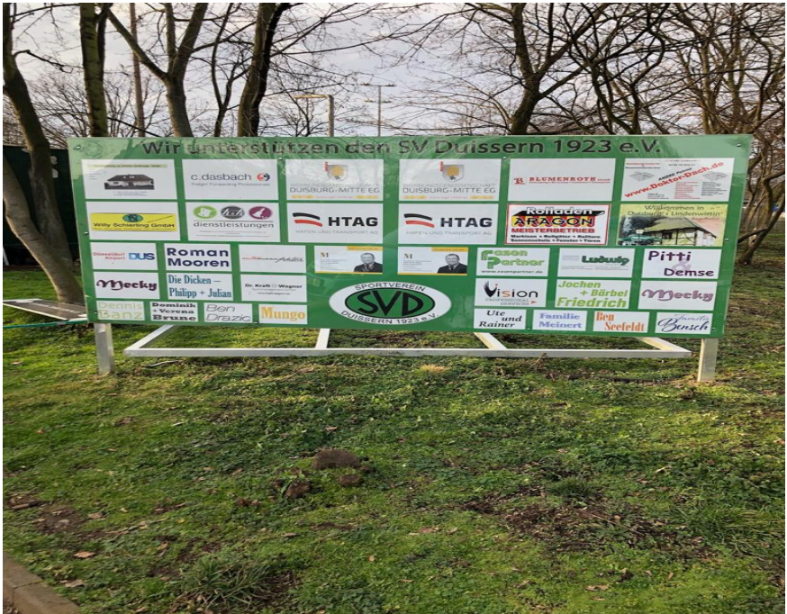
Neu konfiguriertes Werbeschild