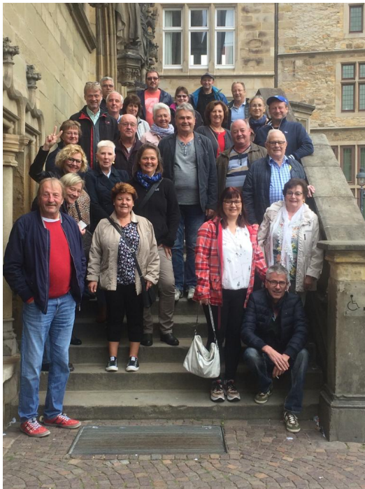
Unsere AH –Tour mit Frauen nach Osnabrück

TuS Gerresheim Damen : Damen SV Duissern : 11:00 Uhr