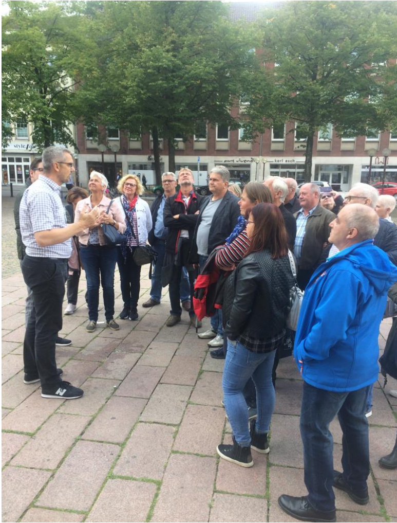
Mit großem Interesse lauschte die Reisegruppe der AH dem historischen Bericht des Domkünsters